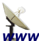
Conexiones por Satélite