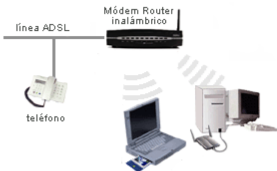
Conexiones Inalámbricas WiFi