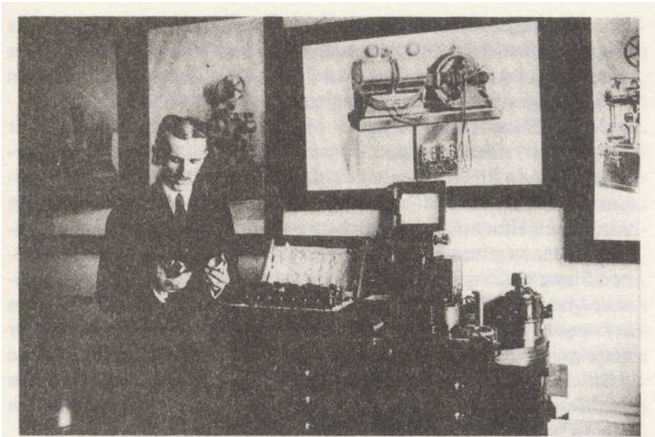
Tesla in seinem Laboratorium in New York

Im Hinblick auf dieses Ziel ist es von größter Bedeutung, den Austausch von Gedanken und gemeinsame Treffen zu unterstützen.